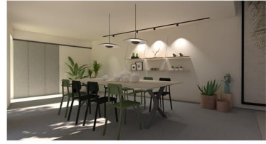
EXEMPLES DE RENDUS PHOTOREALISTES